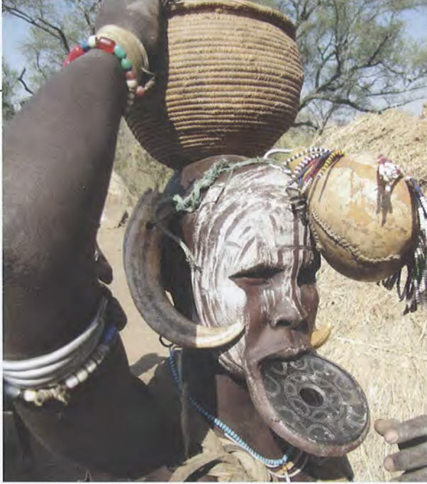
Mursi vrouw